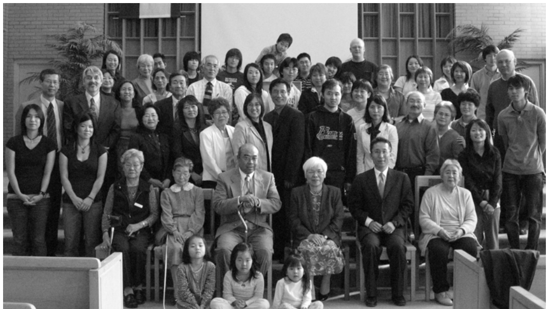
25周年記念礼拝—2006年9月24日 レスブリッジジャパニーズクリスチャンフェローシップ（ファーストバプテスト教会にて）

専任の働き手が与えられて今年で5年。教会形成、信徒の霊的成長、地域伝道、学生伝道。結ばれた実をみる恵みに預かると同時に、自立を目指す教会としての課題も見えてきました。私達自身の足りなさも痛感しています。この25年間の神様の恵みと祝福に感謝しつつ、レスブリッジジャパニーズクリスチャンフェロシッ教会がさらに神様の御心にかなった教会として成長し、教会を通して宣教の働きが拡大していくことを切に祈っています。*